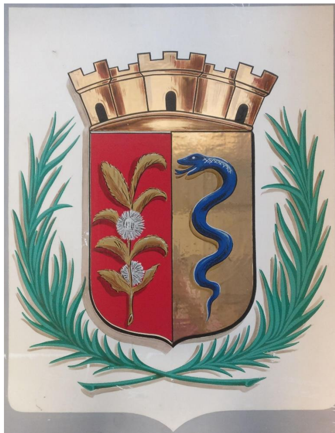
« Parti au premier de gueules à la branche de châtaignier d'or garnie de ses fruits d'argent au deuxième d'or à la couleuvre tortillée d'azur en pal ». Peinture sur bois de Robert Louis, 1942. Archives Communales de Châtenay-Malabry 7Fi72.

Le résultat, publié dans l'ouvrage Les armoiries des communes de la Seine la même année et communiqué aux maires concernés, est pour la ville de Châtenay-Malabry le suivant :